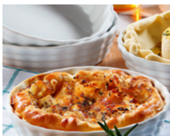
Tartelettes feuilletées au fromage de chèvre