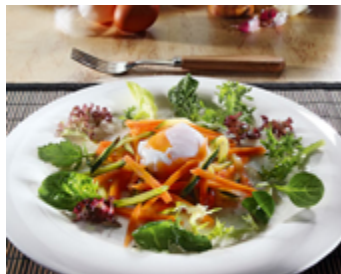
Oeuf poché sur un lit de salade et de légumes