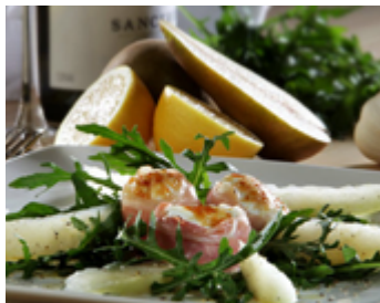
Fromage de chèvre frais gratiné sur salade de roquette et poires