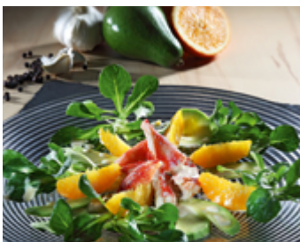
Salade avocat-orange au crabe royal