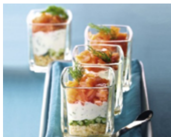
Saumon fumé à la crème d'aneth