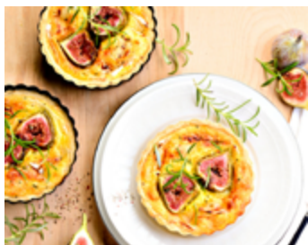
Quiches au fromage de chèvre et figes