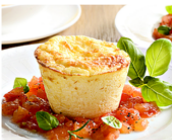
Flan au parmesan sur une concassée de tomates