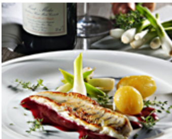
Filets de Sandre au beurre de vin rouge