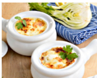
Soupe au fenouil gratinée

Plus d'idées de recettes sur hagengrote.fr